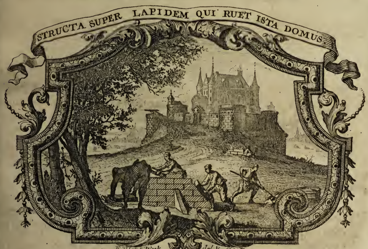
F. Bley's wyk. W. del. & fecit.

Ad diem 15. Julii. 1718. horâ locoque solitis.